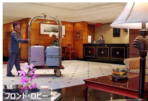
フロント・ロビー