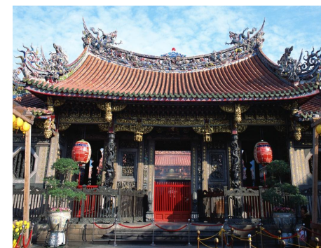
龍山寺（ロンジャンスー）